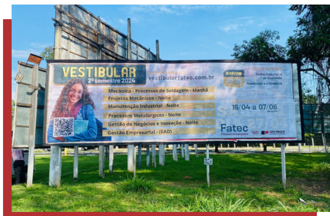
Av. Geraldo José Rodrigues Alckmin Rotatória do Tenda